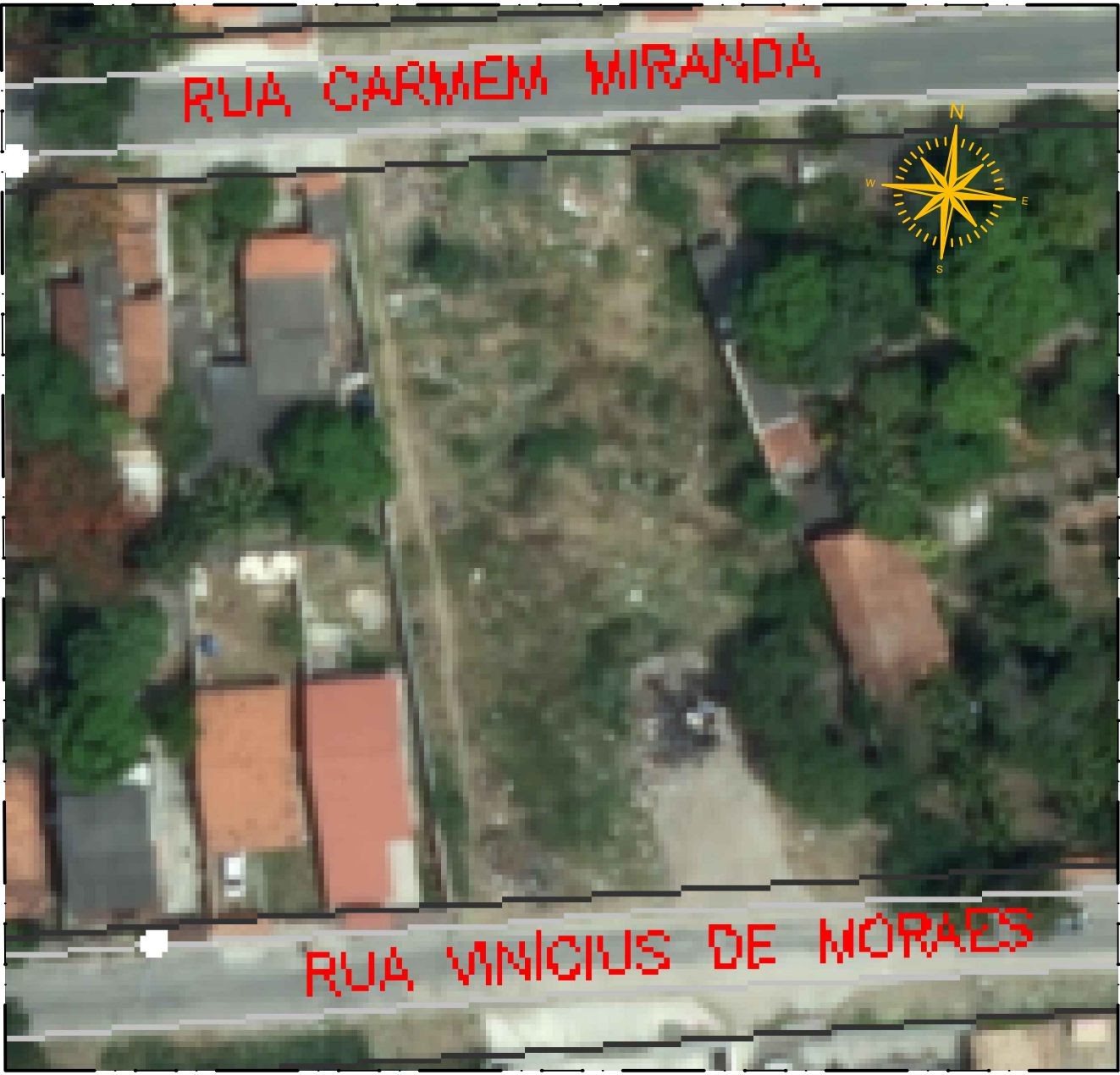
1 PLANTA DE LOCALIZAÇÃO SEM ESCALA