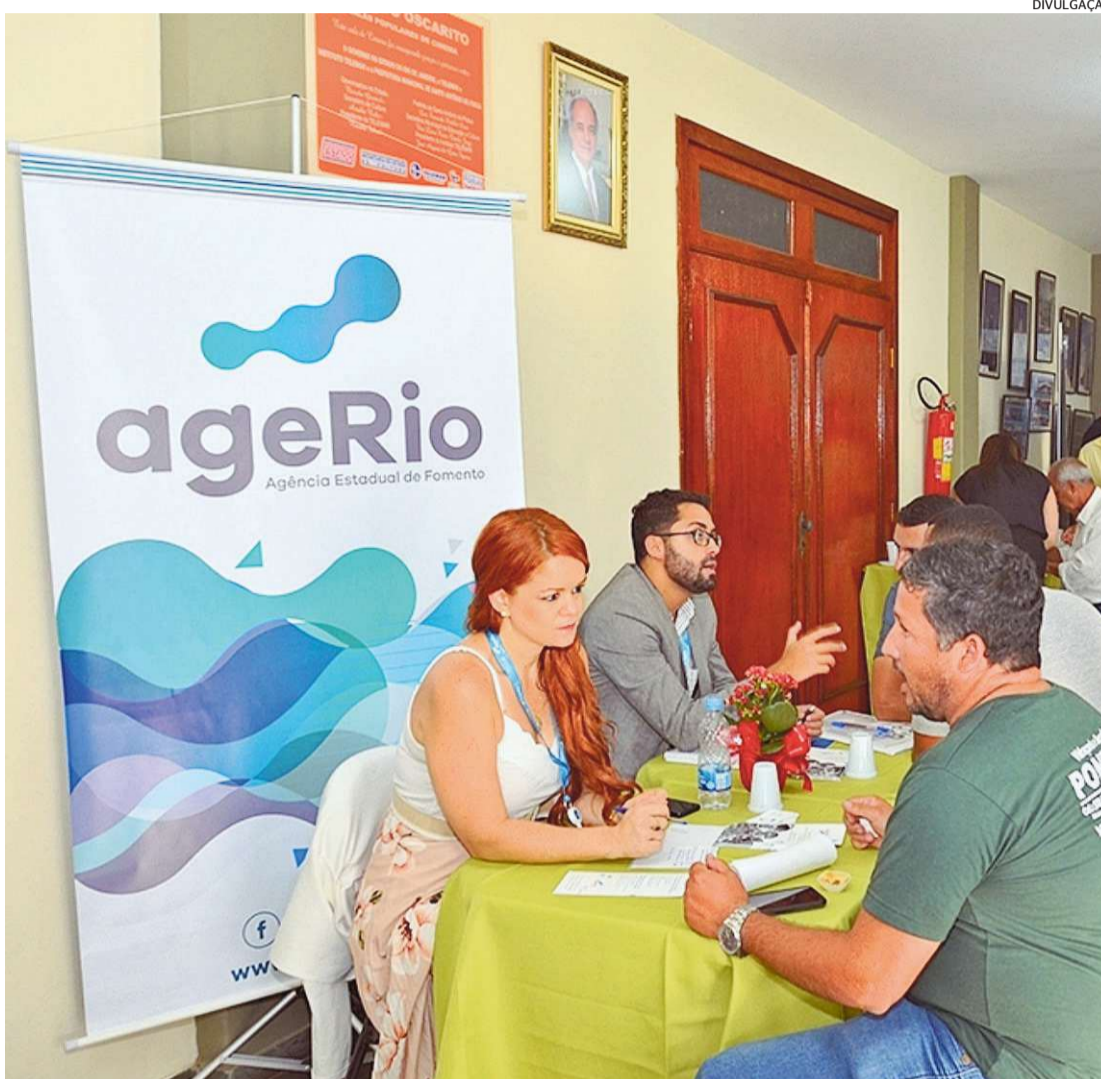
Os microempreendedores individuais devem agendar uma entrevista na AgeRio para obter o crédito