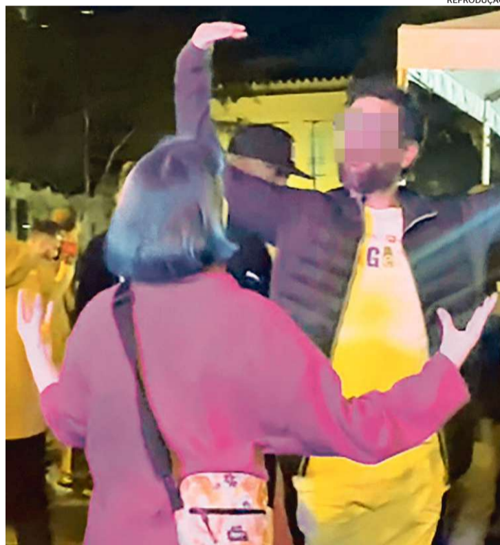
Cena de vídeo que mostra a argentina e o brasileiro na roda

O perfil da AAOrff foi inundado de críticas de brasileiros depois da publicação. Os administradores da página desabilitaram os comentários na postagem.