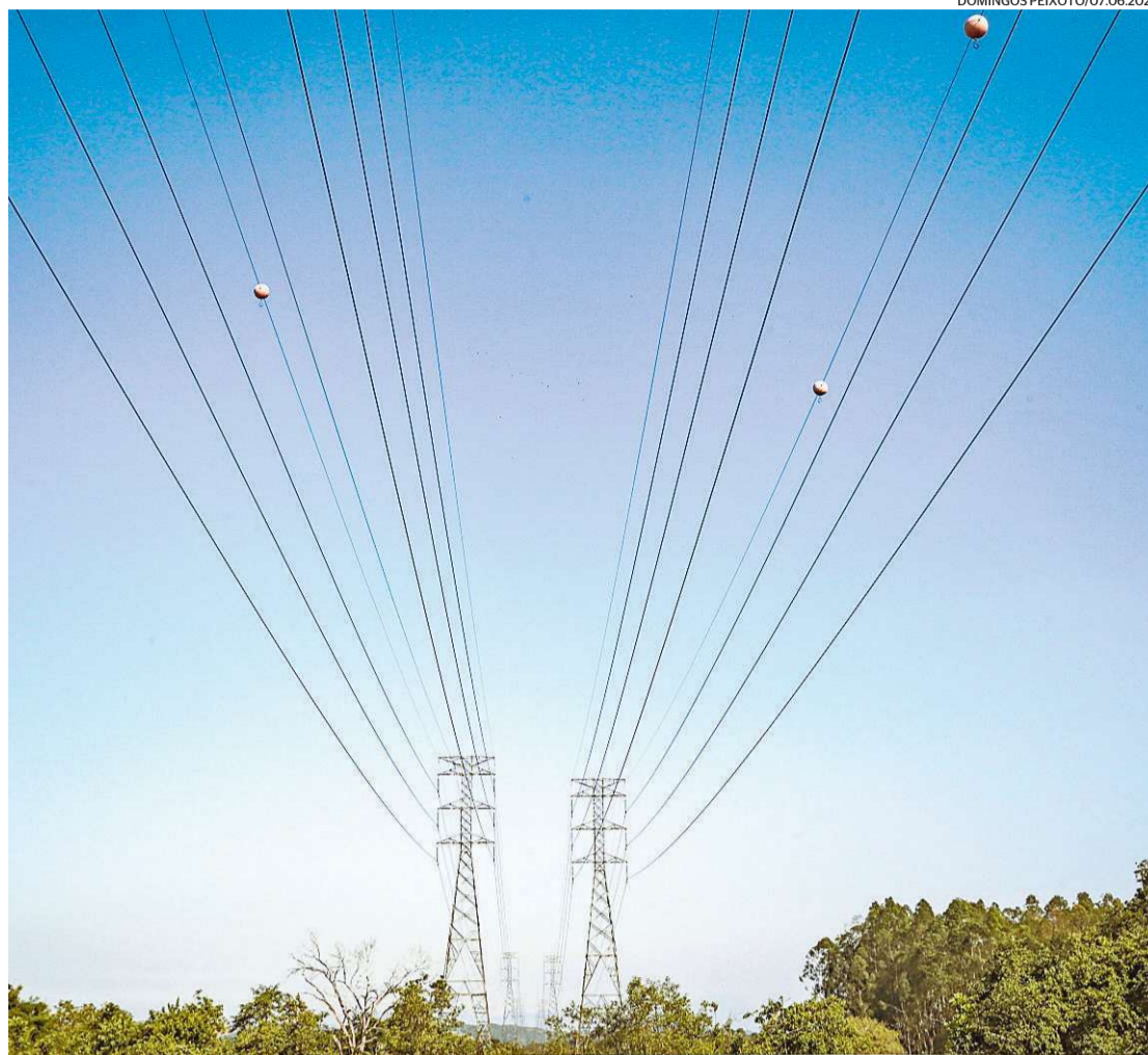
Governo federal quer evitar o aumento do custo da energia elétrica nesses tempos de seca

A bandeira amarela é o primeiro estágio de alerta do sistema. Quando a geração de energia tem custos mais altos, as bandeiras vermelhas (patamares 1 e 2) são acionadas, e a conta de luz sobe. A bandeira de escassez hídrica é mais cara. Neste mês, está em vigor a bandeira vermelha 1, com acréscimo de R$ 4,463 a cada 100 quilowatt-hora consumidos.