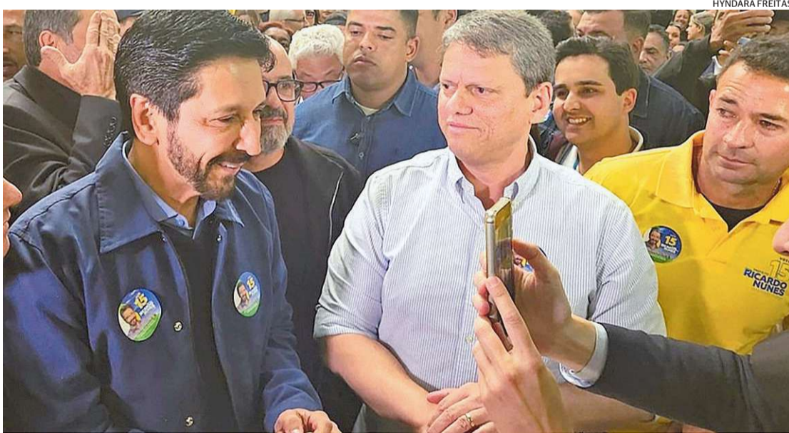
Nunes, que tem apoio do governador Tarcísio, teme que eleitorado migre para Pablo Marçal

Ao mesmo tempo, subiu o tom ao afirmar que Bolsonaro “tem palavra” e que não acre-