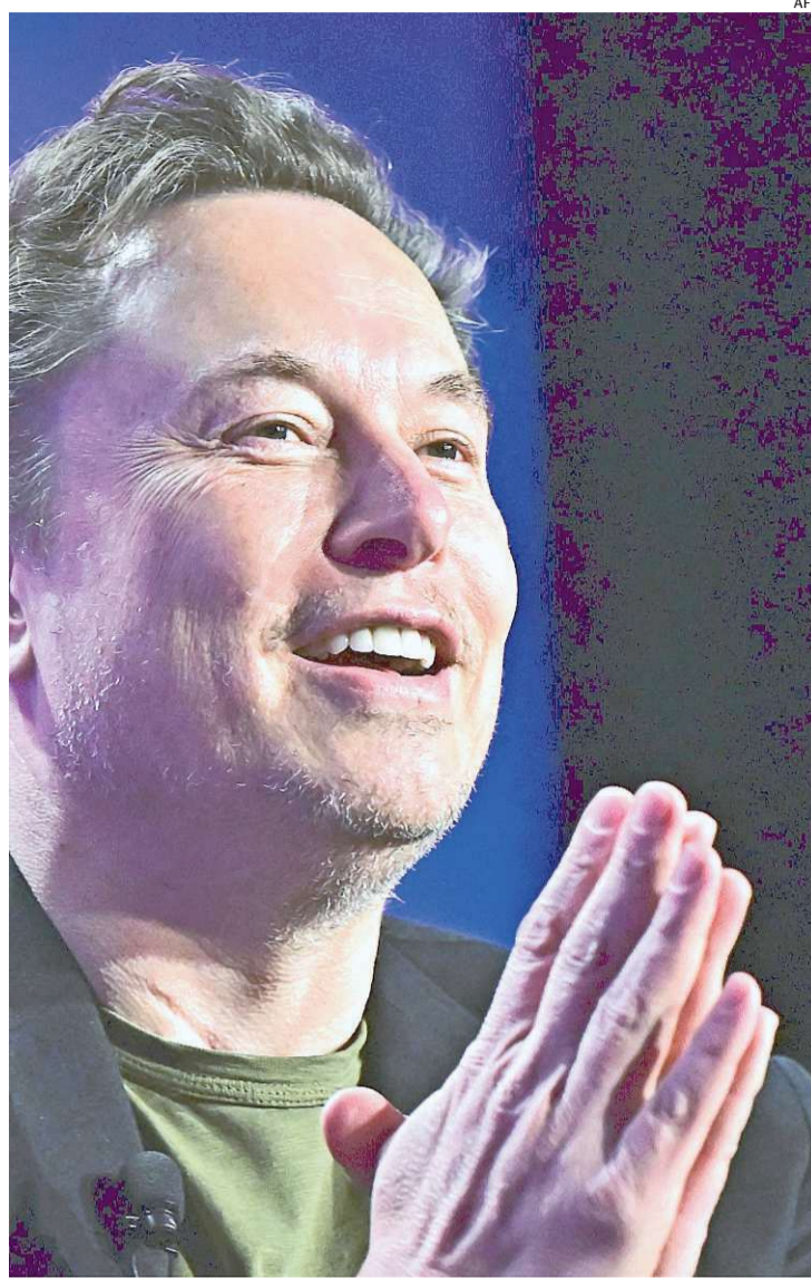
Musk trava embate com o STF desde abril ao descumprir decisões

Em publicação no X, a Starlink classificou como “infundada” a ideia de que tem que ser responsabilizada pelas multas aplicadas contra a rede social e considerou “inconstitucionais” as punições aplicadas devido a não retirada de perfis. “(A ordem) foi dada de forma sigilosa e sem permitir à Starlink o devido processo legal garantido pela Constituição do Brasil. Pretendemos lidar com essa matéria legalmente”, diz o texto.